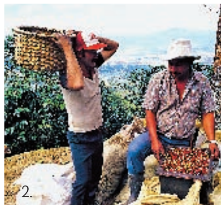
1. En el sur encontramos hermosas playas 2. Costa Rica produce exquisitos cafés

A partir de Limón y hasta la frontera con Panamá se encuentra el Caribe Sur, cuya mezcla de playas, recursos naturales y cultura afrocaribeña procedente de localidades como Cahuita, Puerto Viejo o Gandoca-Manzanillo resaltan la sensación de que este país resume en pocos kilómetros factores diferenciales únicos. Aunque Costa Rica no destaca por sus monumentos o su historia, en esta zona la música, la arquitectura y la gastronomía se