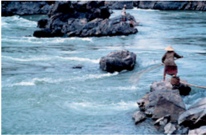
Pescadora echando sus redes cerca de una catarata.

Mister Kong tiene en la isla de Don Det un restaurante, el King Kong, donde su mujer cocina los mejores rollos de primavera del país. También posee un par de bungalows de madera y