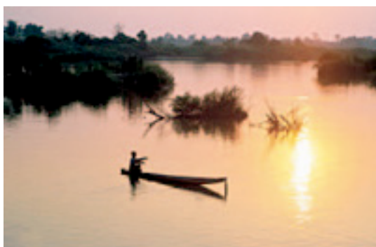
Atardecer en el Mekong, al oeste de Don Det

Desde el pueblo de Ban Nakasong se puede alquilar una motocicleta o tomar un tuk(taxi de tres ruedas) y pedir que nos lleven a las aún más espectaculares cataratas de Phapheng, a