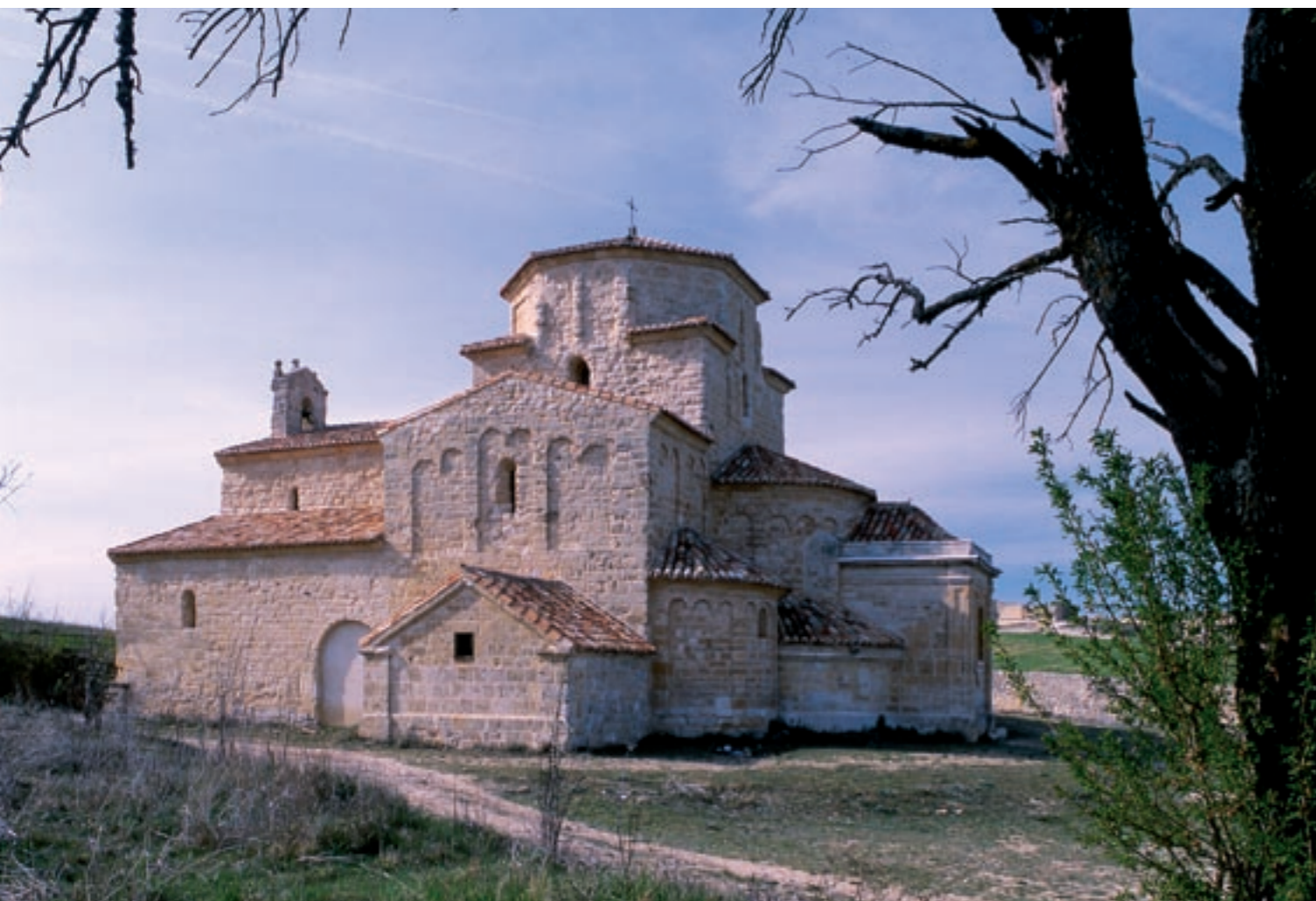
La iglesia de La Anunciada es la única muestra de arquitectura románica lombarda en Castilla y León.