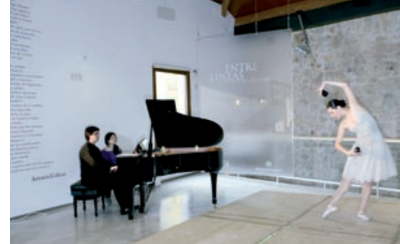
La lectura, la escritura y la música son notas protagonistas en este pueblo que acoge la Fundación Joaquín Díaz, una de las mayores colecciones de instrumentos musicales antiguos

ello, antiguos solares destinados a la economía ganadera (establos, corrales, cochineras...), y se ofrecieron en régimen de alquiler a precios muy competitivos a los libreros que quisieran formar parte de un proyecto que en un principio incluía solo libros de segunda mano. Con el tiempo la filosofía cambió y se abrió la posibilidad a otro tipo de establecimientos libreros, con el riesgo que suponía para los pioneros abrir su negocio en una localidad pequeña y relativamente alejada de los grandes espacios de la cultura. Los primeros meses de andadura han demostrado que, de momento, la idea está resultando un éxito, con más de 65.000 visitantes desde su inauguración oficial.